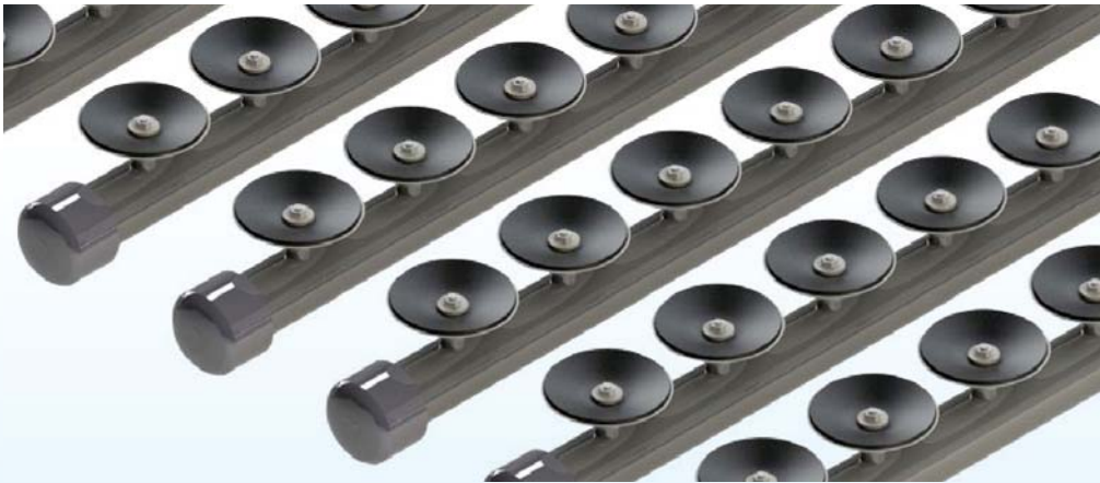
AIR DIFFUSER MB