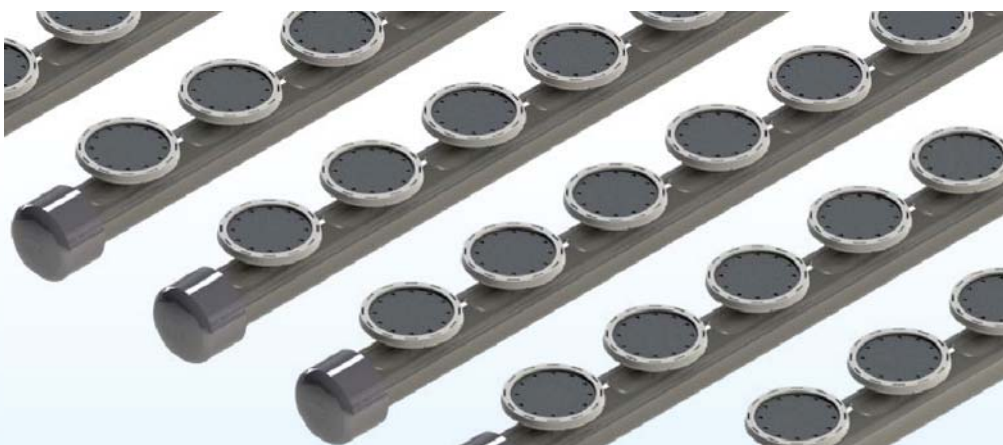
AIR DIFFUSER MBW

E' disponibile su richiesta diffusore MBW con valvola di non ritorno integrata - MBW diffuser with integrated check valve is available on demand